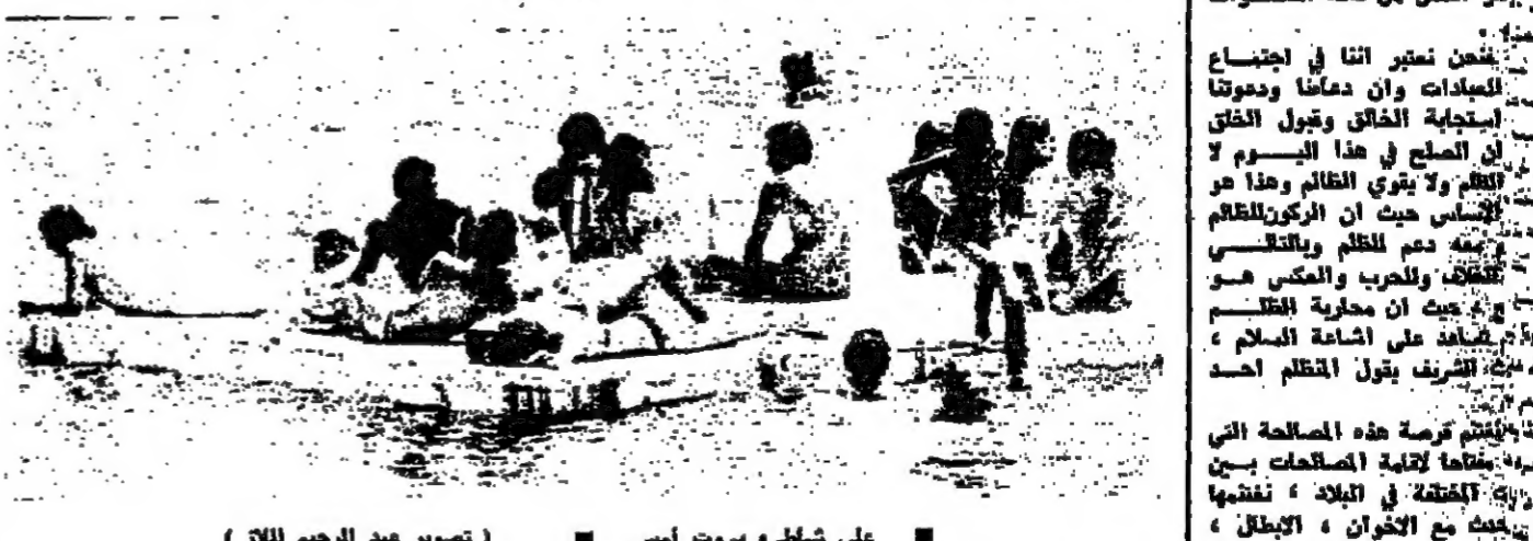
على شاطئ بيروت أمس

ودعت العاصمة لبث ، اسبوعا كايلا من الجهود والاستقرار ، وهي اند نفالوا باستمرار الحياة الطبيعية . كانت تنفض عنها غيل الخوف والقلق ، لستقبل الازم المقبلة وهي اكثر الخطانا وسعادة . وقدر « الهروب » الاثري من العاصمة ، كان الازبال على المسبح والشواطئ والامكن الجبلية العالية . بعض سكان العاصمة « حاربوا » الحرارة ببرودة الجبال ، وبعضهم حارب على « جبة البحر » حيث اصعدت الازم الاضداد خلاصتها احيانا ، وداعية الازواج في معظم الاحيان ، مناصحة الازم المصيبة التي مرت ، منصفة في ماء التسامح والفرحان . ومع موجة الازبال التي بلغت لورونها ، غابت المسبح الى نظيف نظام « اشتراكات الخاصة » ، ومنتع غير الحاصلين عليها من ارتدادها ، ناقضت الازواج الى التوجه نحو المسبح لتستريح في الازواجي ، ونحو الشواطئ البعيدة غير الخاصة لتعرفه الدخول . ازحام في الجبال وشهدت الامكن الجبلية ، ازحاما ملحوظا ، حيث امتلأت بالزوار والزبائن ، ولكن معظم هؤلاء كانوا من اللبنانيين ومن سكان الجبال ، لان موسم الصيف للناشرين من الخارج لم يبدأ ، وقد يبدأ ملاحرا ، وقد لا يبدأ ولا ينتهي فيما تطورات الظروف . وشبه مهم لحاظه المواطنين امس ، هو عودة الهدوء والنقا الى القريوس ، بعد غياب اصوات الرصاص والحواش العربية .